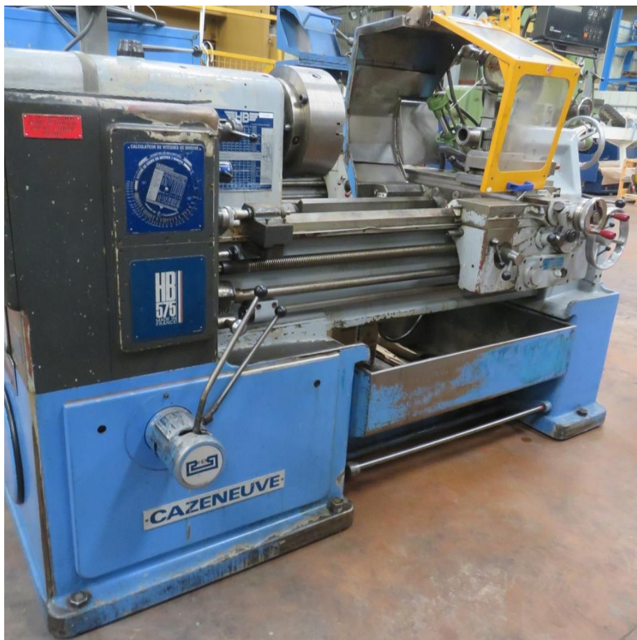
Référence interne : T21006