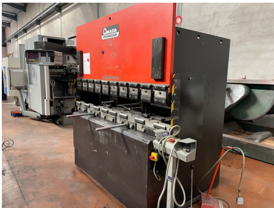
Référence interne : T23046