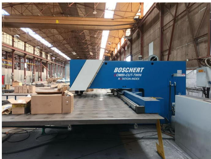
Source plasma HPR 130