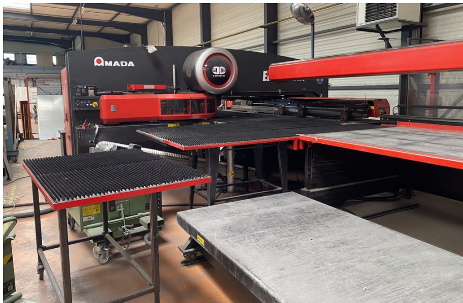
Référence interne : I00088