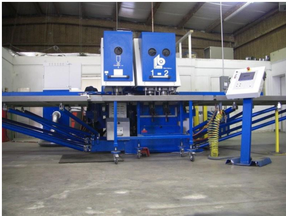
Référence interne : T22063