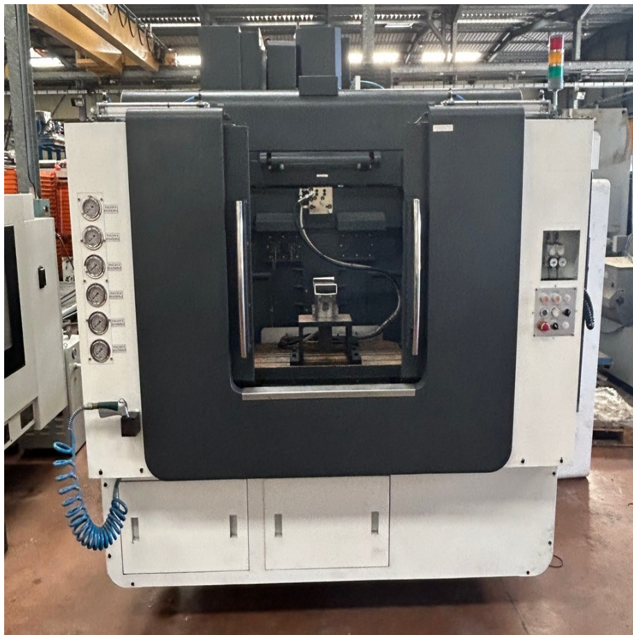
Référence interne : T23047